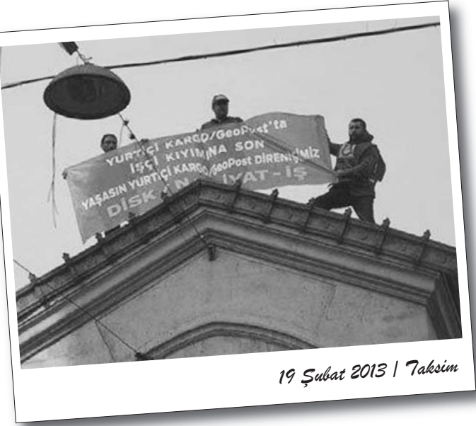
19 Şubat 2013 | Taksim

Sermayenin ücret ve örgütlenme hakkına saldırıları, işçiler tarafından eylemlerle karşılanıyor. Emekçiler, karşı karşıya kaldıkları her türlü saldırı karşısında yine sokaklara çıkarak, örgütlenerek sermayeye anladığı dilden cevap veriyorlar.