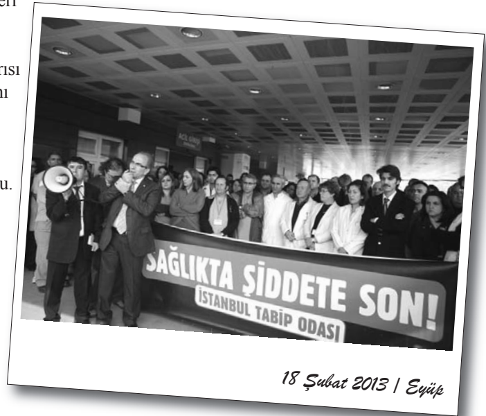
18 Şubat 2013 | Eyüp

İşçilerin ve sendikanın kararlılığı hızla sonuç verdi. Tek Gıda İş 16 Şubat'ta yaptığı açıklamayla patronun işçileri geri alacağını ve sendikal yetkileri tanıyacağını duyurdu.