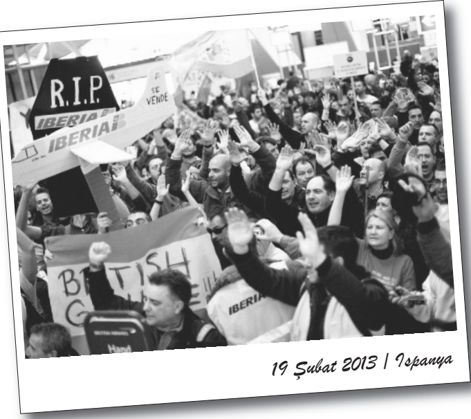
19 Şubat 2013 | İspanya

İşçi ve emekçiler dünyanın bir çok yerinde ayağa kalktı. Avrupa ülkelerinde işçiler, kapitalist krizin faturasının kendilerine kesilmesine karşı sokağa çıktı. Grev ve eylemlerle öfkelerini alanlara aktı.